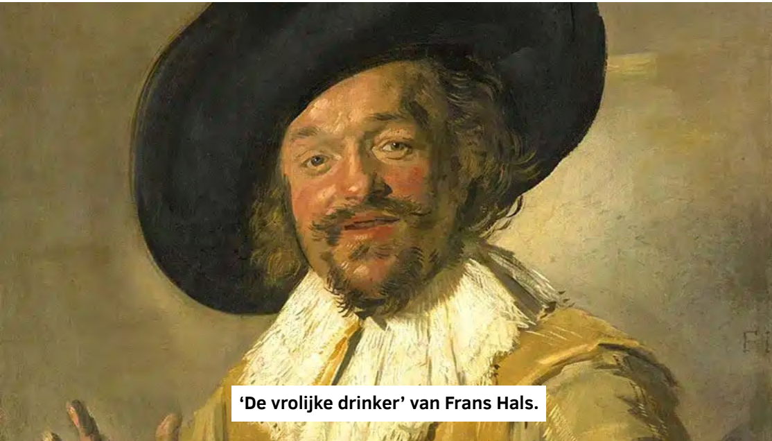
'De vrolijke drinker' van Frans Hals.