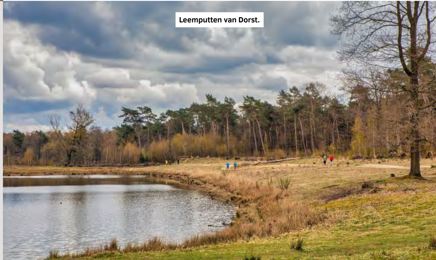
Leemputten van Dorst.