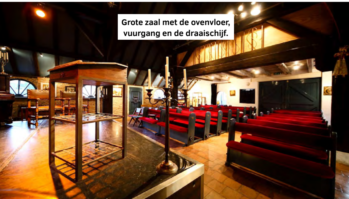
Grote zaal met de ovenvloer, vuurgang en de draaischijf.