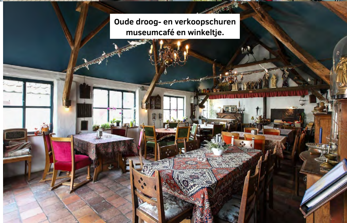
Oude droog- en verkoopschuren museumcafé en winkeltje.

Doordat de grote zaal beperkt is in mogelijkheden (en de droog en verkoopschuren een andere functie vervullen), zal de tuin een belangrijk onderdeel worden van de expositie.