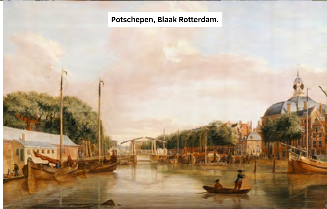
Potschepen, Blaak Rotterdam.