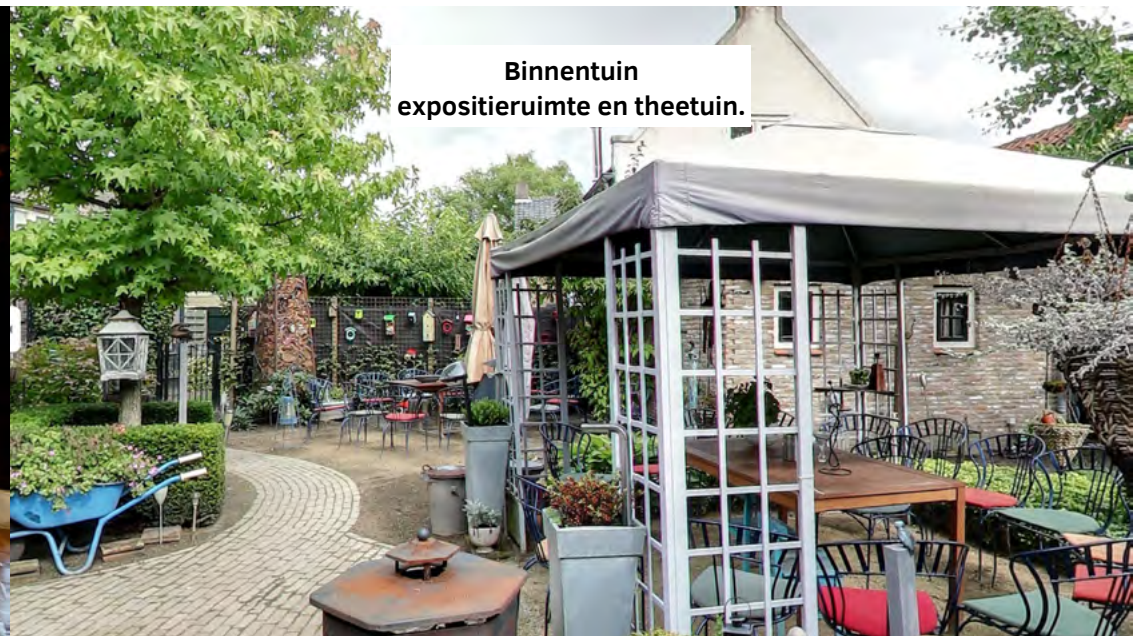
Binnentuin expositieruimte en theetuin.

Het totale complex is een hectare groot en omvat het volledige productieproces.