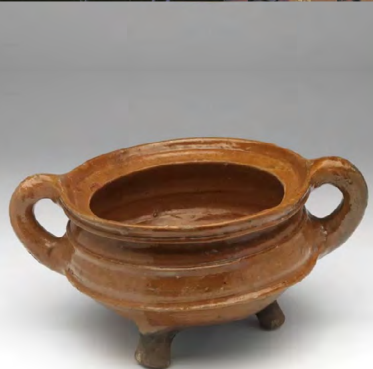
Een Oosterhoutse kookpot uit ca. 1650 van roodbakend loodglazuuraardewerk.

Het Oosterhouts aardewerk is teruggevonden over de hele wereld, van Indonesië tot op Spitsbergen en heeft een plek gevonden op één van de mooiste kunstwerken uit de 17e eeuw: Het Melkmeisje van Vermeer.